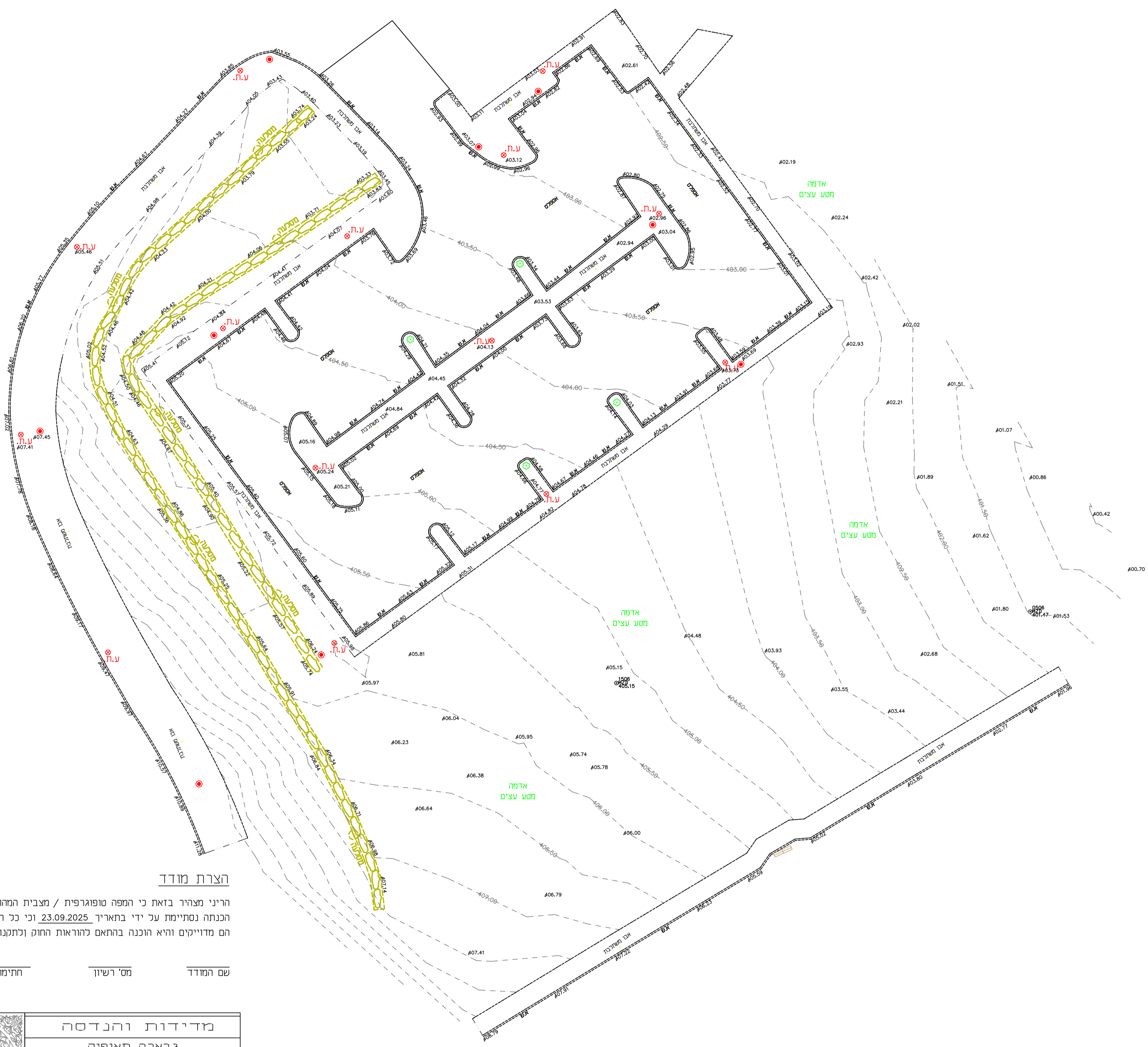
תרשים הסביבה קנה מידה 1: 5000

מחוז : יהודה ושומרון . נפח : בית לחם . המקום : מעלה אדומים , ע"פ תב"ע מס' 420/1/7/2 . הוכן עבור : הבעלים .